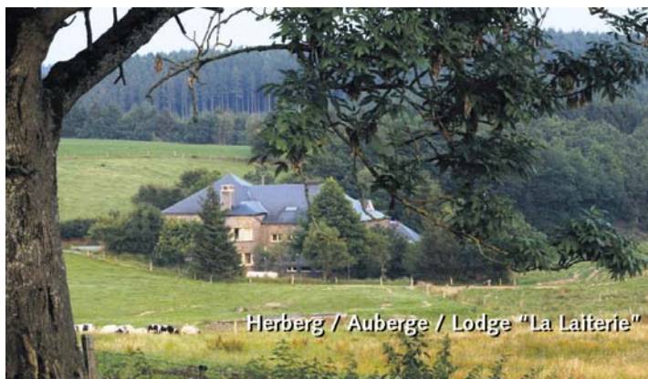
Herberg / Auberge / Lodge "La Laiterie"