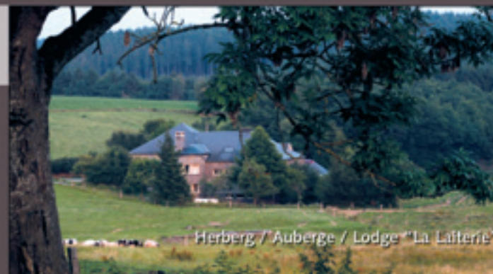
Herberg / Auberge / Lodge "La Laiterie"